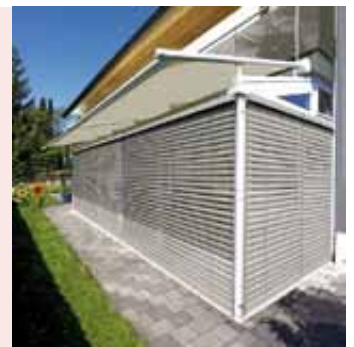
Foto rechts: Die Einbindung von Markisen in Hausautomationssysteme macht die Steuerung besonders einfach und sicher.

► Meist haben die kalten, feuchten Wintertage sichtbare Spuren hinterlassen. Bevor der Terrassenspaß beginnen kann, müssen daher zunächst Grünbeläge vom Boden entfernt, die Gartenmöbel auf Vordermann gebracht und weitere Verschönerungsarbeiten in Angriff genommen werden. Auch dem Sonnenschutz für einen angenehmen Aufenthalt im eigenen Garten sollte man jetzt verstärkt Aufmerksamkeit schenken. Denn nicht erst im Hochsommer, sondern bereits an warmen Frühlingstagen kann die Sonne so stark scheinen, dass erst eine